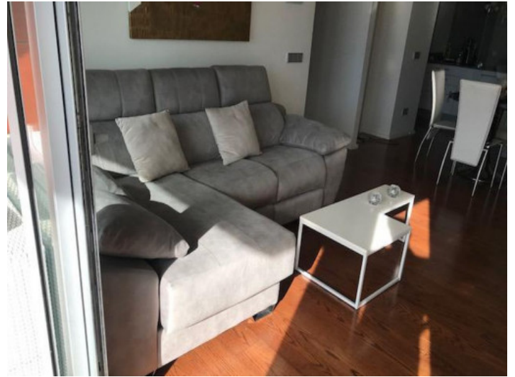
Salón comedor abierto