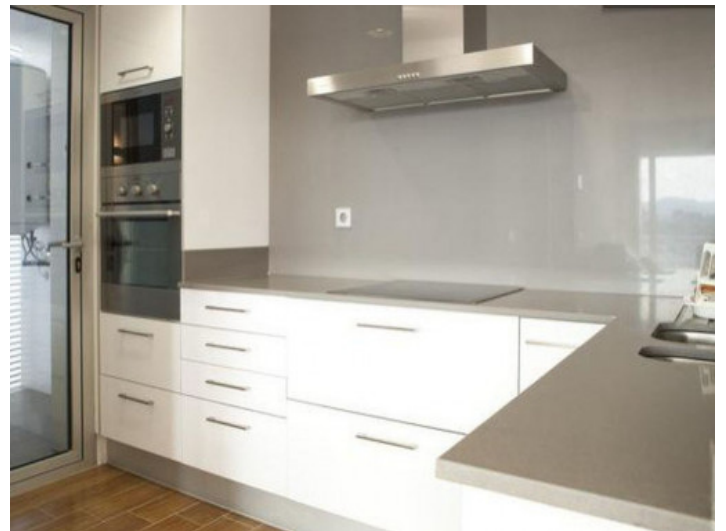
Cocina totalmente equipada