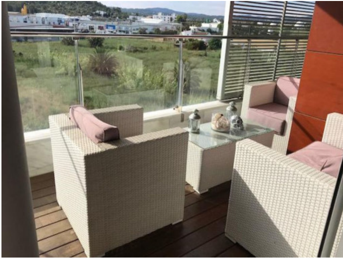
Zona de estar en el balcón