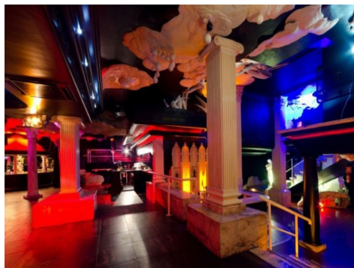
Vista alternativa a la pista de baile