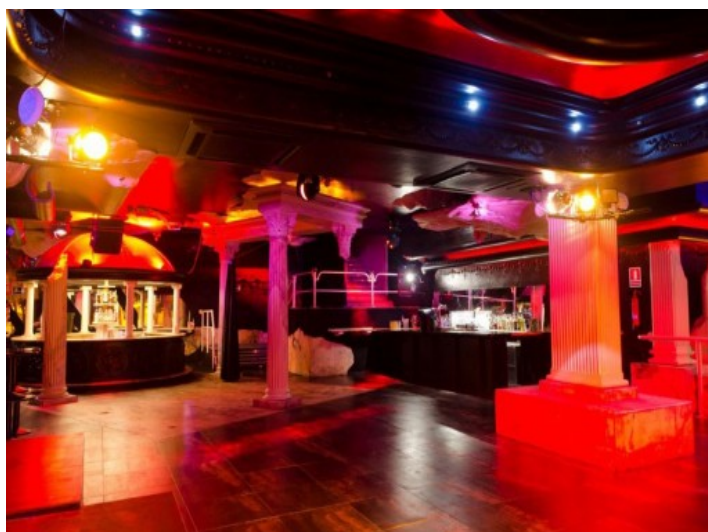
Vista a la pista de baile