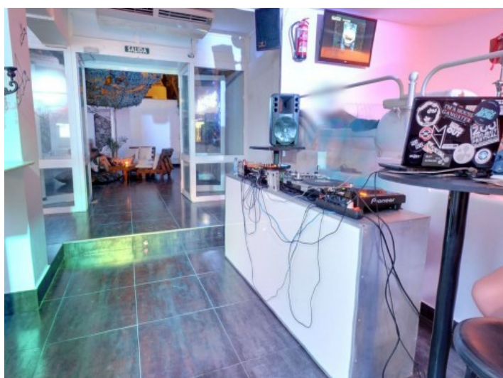
Zona del DJ