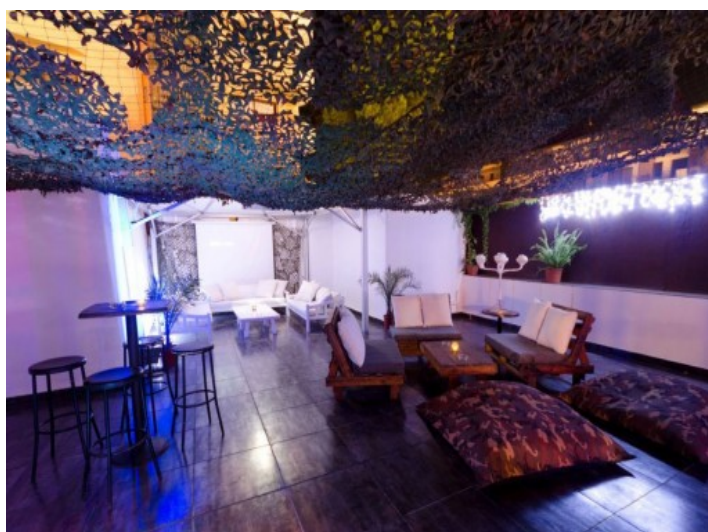
Zona de estar

Toda la información como mejor se puede saber, salvo por error durante el periodo de venta. Sirva este documento como un informe previo, las bases legales solo serán válidas a través de un contrato de compra acordado ante Notario.