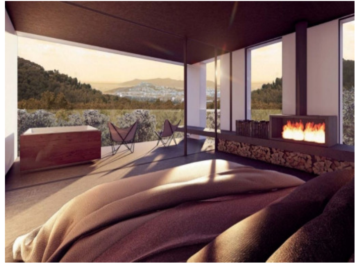
Dormitorio con vista a Dalt Vila