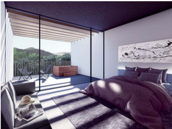
Ventanas panorámicas del dormitorio