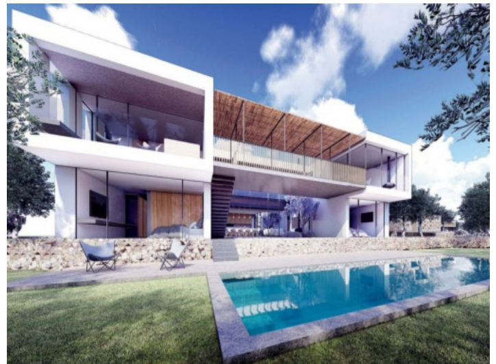
Vista exterior de la villa y piscina