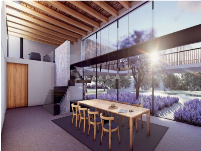
Salón-comedor inundado por luz natural